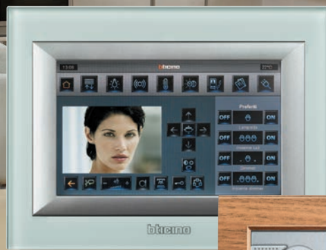
Multimedia und Beschallung