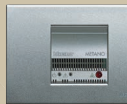
Austrittsalarm (Gas, W)